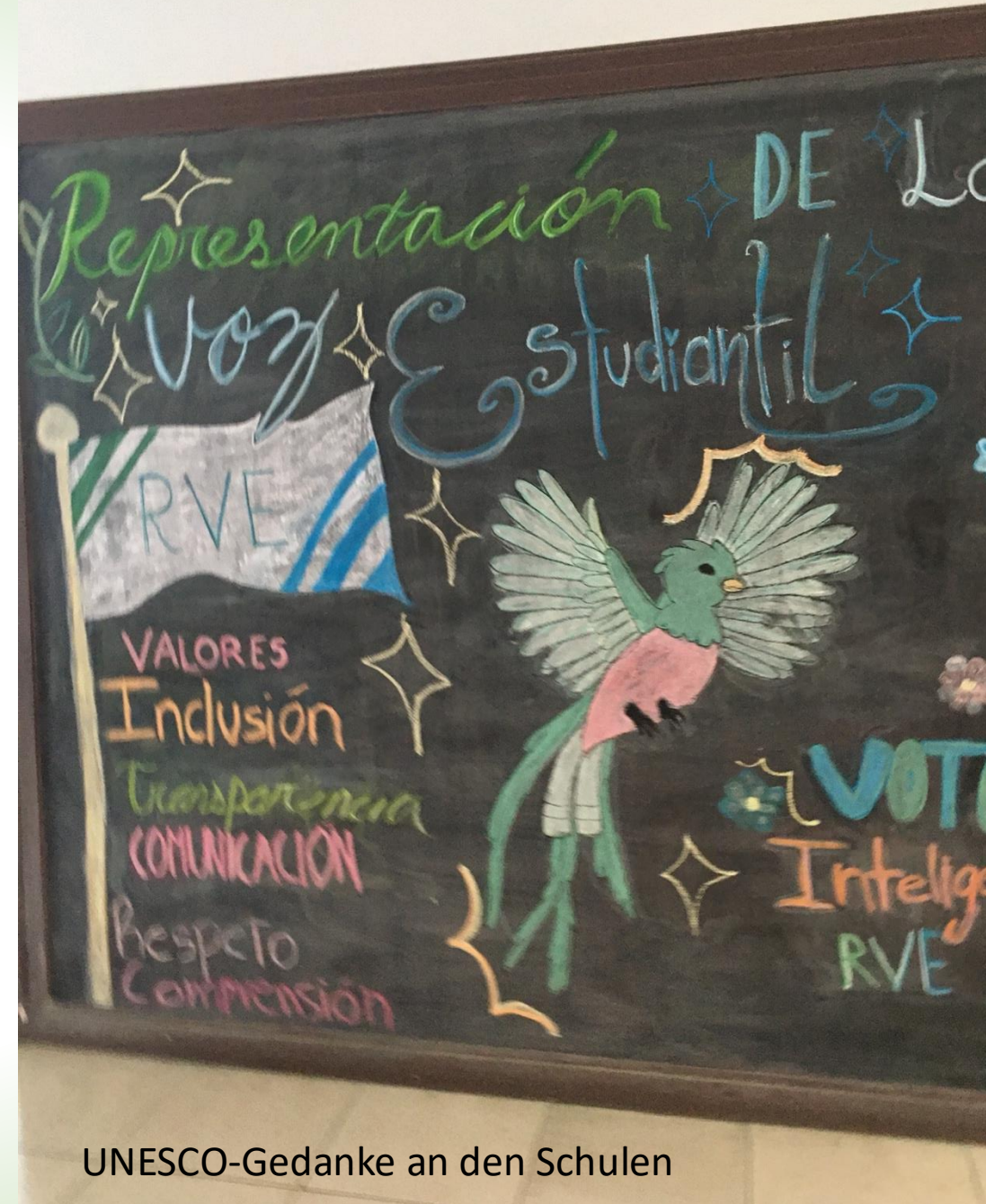
UNESCO-Gedanke an den Schulen

Wir sind zu Gast in vier Schulen des Colegio Humanistico Costarrience bei jeweils einer/m Gastschüler:in und einer Gastfamilie.